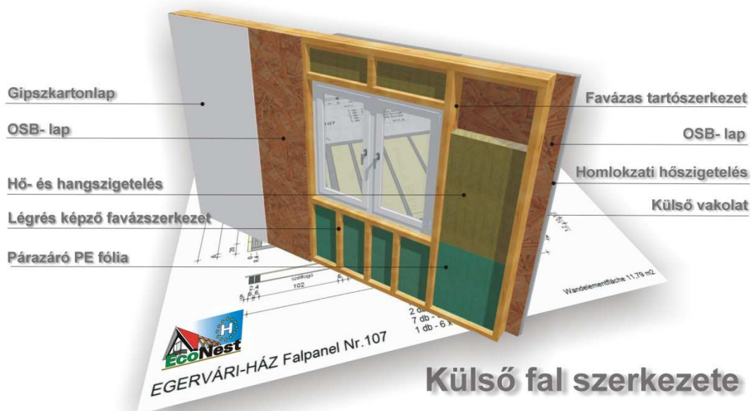
Külső fal szerkezete